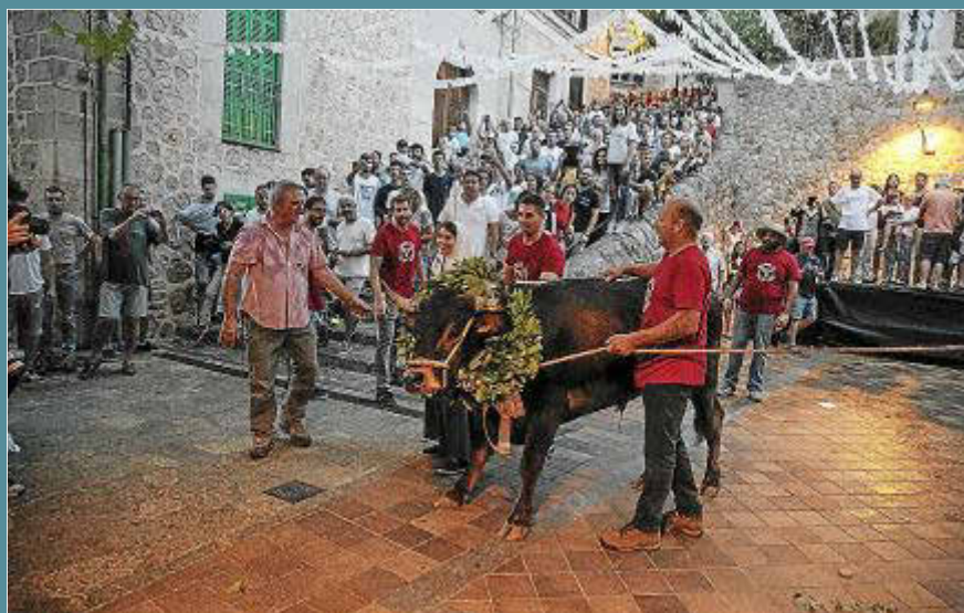
La lluvia deslució la Baixada del Bou, conforme a la nueva ley.

ro descenderá hasta la plaza por el último tramo del denominado Camí de s'Alzina Fumadora, también conocido como Camí de Tramuntana. El tramo desde la carretera del cruce hasta la plaza es de solamente unos 500 metros pero con una fuerte pendiente y muy estrecho, por lo que el público solamente podrá ver el animal desde propiedades privadas colindantes a excepción en el último tramo ya llegando a la iglesia y a la plaza. Los preparativos han sido minuciosos hasta el último momento ya que no se descarta que pueda haber alguna protesta animalista, incluso después de haberse «pacificado» al máximo la fiesta. Los mayores están muy contentos por la recuperación del trazado (...).