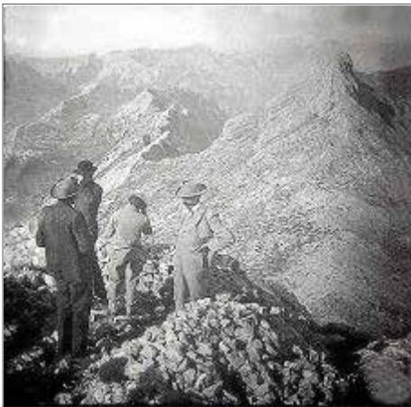
El Puig Major a principios de 1900, imagen perteneciente al archivo familiar Pablo Nadal (Uruguay). Foto: Arxiu Can Xoroi

El escritor de nacionalidad canadiense, Robert Goulet regenta en Fornalutx un restaurante llamado Posada de Bàltx, situado en la finca del mismo nombre, que recibió recientemente una orden de cierre del Ayuntamiento, alegando que carecía del oportuno permiso municipal (...).