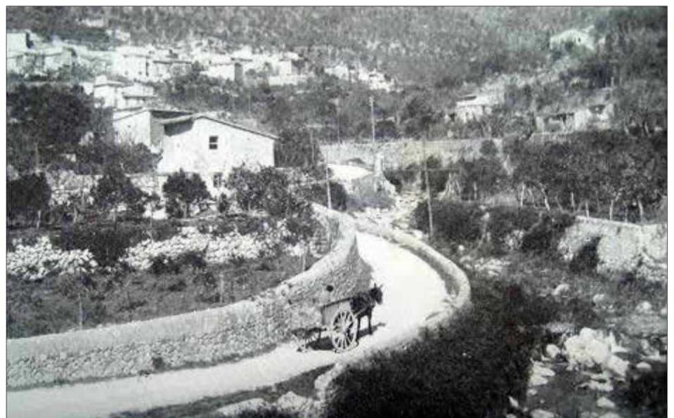
Imagen de la subida en carro por el torrente de Fornalutx.

L'esdevenir del nostre poble queda reflectit en aquest especial monogràfic que teniu a les mans i en el qual Última Hora desgrana, any a any, alguns dels esdeveniments que han succeït a Fornalutx i que també han marcat la nostra història. És ben cert que la nostra relació amb la ciutat de la Vall ha estat i és encara important, però Fornalutx ha sabut fer-se un lloc propi en el mapa de la història municipal. A finals del segle XIX y principis del XX les epidèmies sacsejaren la nostra contrada, com també succeï a altres municipis. Però Fornalutx, no fou un poble aïllat entre muntanyes, prova d'això ho trobam en notícies com la que apareix al diari el 1916 quan es dona mostra de l'alegria dels habitants de la nostra vila pels tramvies elèctrics de Ciutat o l'impuls que donà, un any abans, l'estació telegràfica. Fets importants com la compra de l'edifici de Can Xoroi per part de l'Ajuntament, el reconeixement com a poble de Bé d'Interès Cultural o l'entrada de Fornalutx en el selectiu grup dels «Pueblos más bonitos de España» són algunes mostres més recents que també surten reflectides en aquest monogràfic. Tot això demostra que Fornalutx ha sabut mantenir els seu llegat patrimonial i cultural, però sempre amb la mirada posada cap els nous temps.