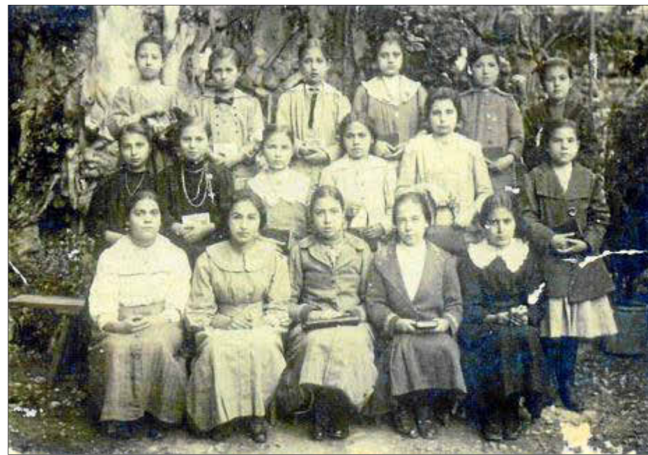
Niñas en la escuela de Fornalutx en 1931