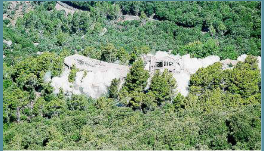
Imagen de la explosión que provocó la voladura del hotel.